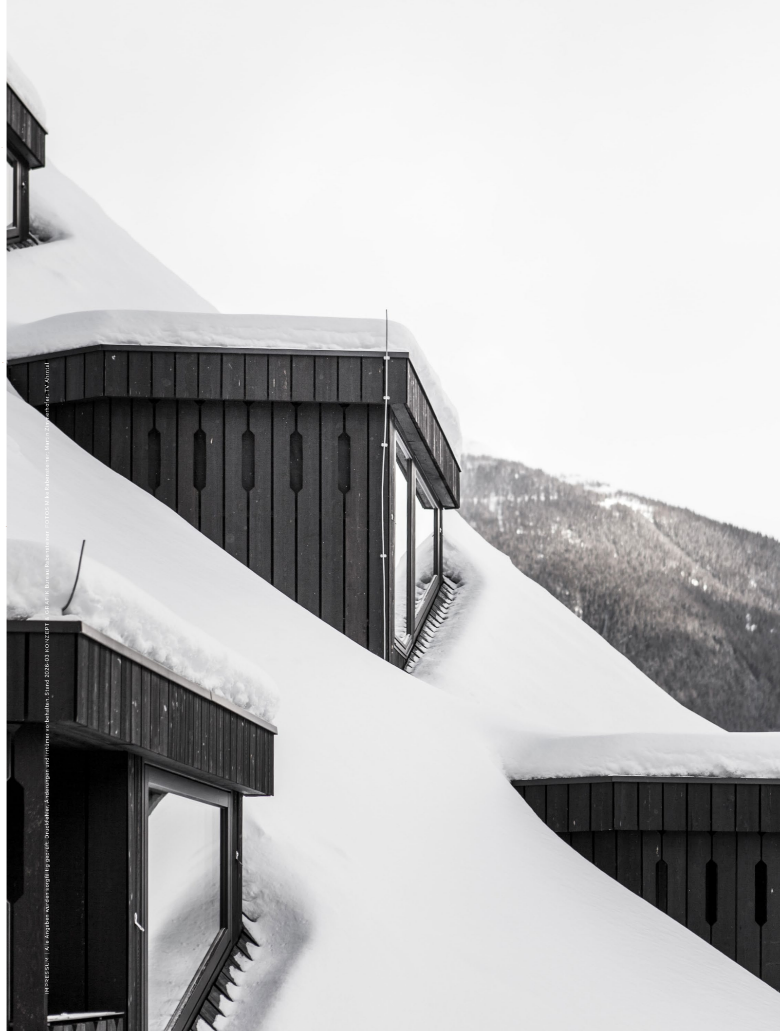
IMPRESSUM | Alle Angaben wurden sorgfältig geprüft. Druckfehler, Änderungen und Irrtümer vorbehalten. Stand 2026-03. KONZEPT: G.P. A&K, Bureau Rubenstein.