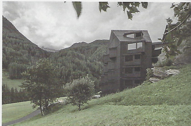
Wanderhotel Bühelwirt: „Weiterbauen am Bestand“

Zu dem von AIT-Dialog ausgelobten AIT-Award Best in Interior and Architecture waren fast 800 Arbeiten aus 36 Ländern eingereicht worden. Die Arbeiten verteilen sich auf zwölf verschiedene Kategorien: Wohnen, Hotel, Gastronomie, Retail/Messe, Büro/Verwaltung, Gesundheit/Pflege, Sport/Freizeit, Öffentliche Bauten/Kultur, Bildung, Industrie/Gewerbe und die zwei Sonderkategorien Wohnmodelle der Zukunft und Newcomer. Die hochkarätig besetzte Jury wählte in den ersten zwei Rundgängen die zehn bis fünfzehn besten Projekte in jeder Kategorie aus. In der dritten Runde wurden diese Einreichungen erneut diskutiert und schließlich wurde festgelegt, welche mit Preisen oder Auszeichnungen